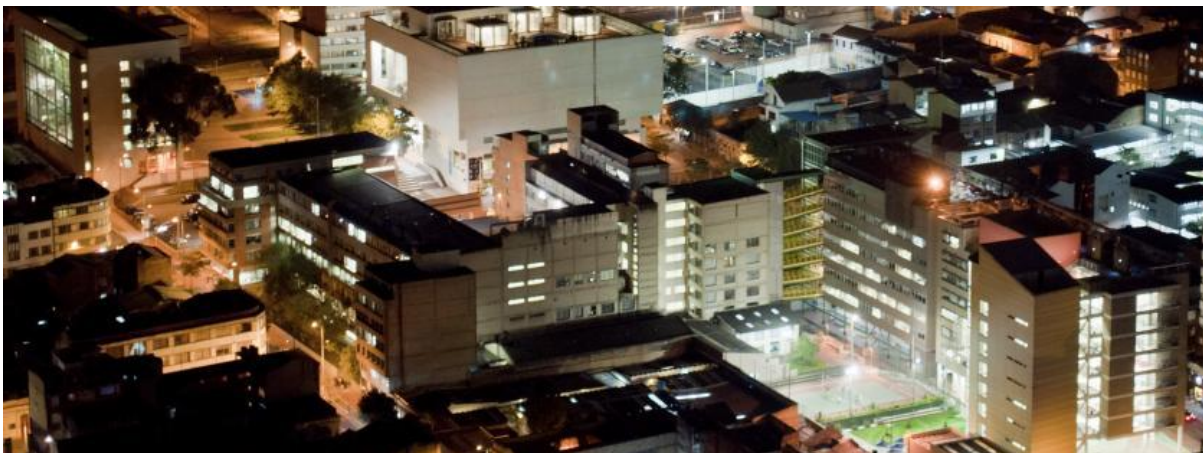
UNIVERSIDAD DE BOGOTÁ JORGE TADEO LOZANO www.utadeo.edu.co

La Red Colombiana de Semilleros de Investigación RedColsi NODO BOGOTÁ – CUNDINAMARCA tiene el agrado de invitar nuevamente a la comunidad investigativa estudiantil a nuestro XVI Encuentro Regional de Semilleros de Investigación.