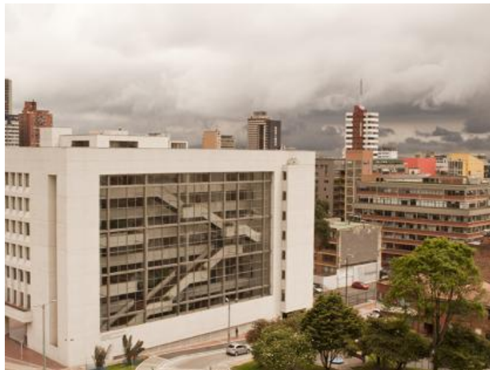
UNIVERSIDAD DE BOGOTÁ JORGE TADEO LOZANO