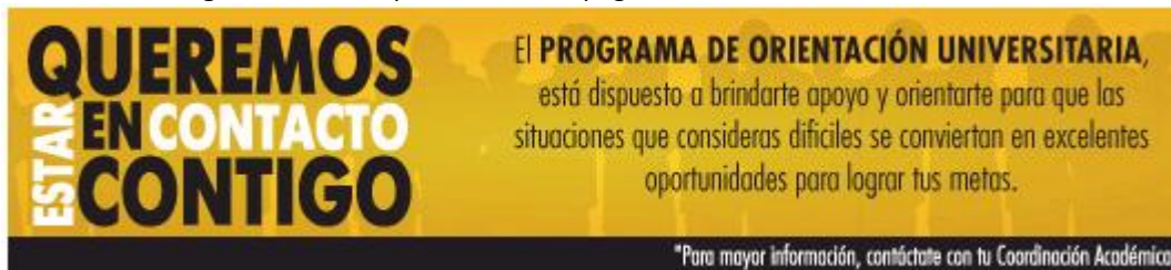
Figura 1. Banner publicado en la página web de la Universidad Piloto