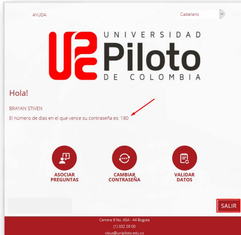
Imagen 9 - Actualización de días de vigencias de contraseña