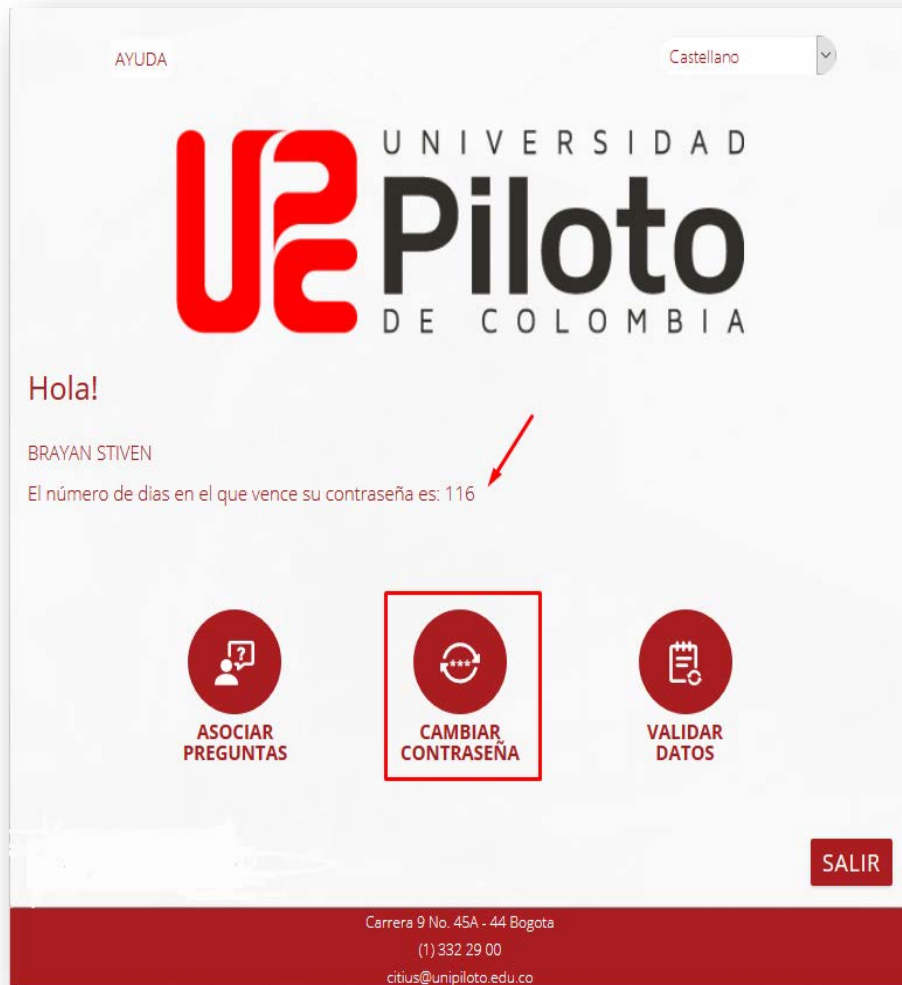
Imagen 5 - Opciones CRONOS

Al seleccionar la opción de Cambiar Contraseña , nos dirige a la pestaña donde haremos dicho cambio, pero antes de realizar el cambio; la contraseña debe cumplir ciertas métricas de seguridad esto con el fin de obtener una contraseña segura.