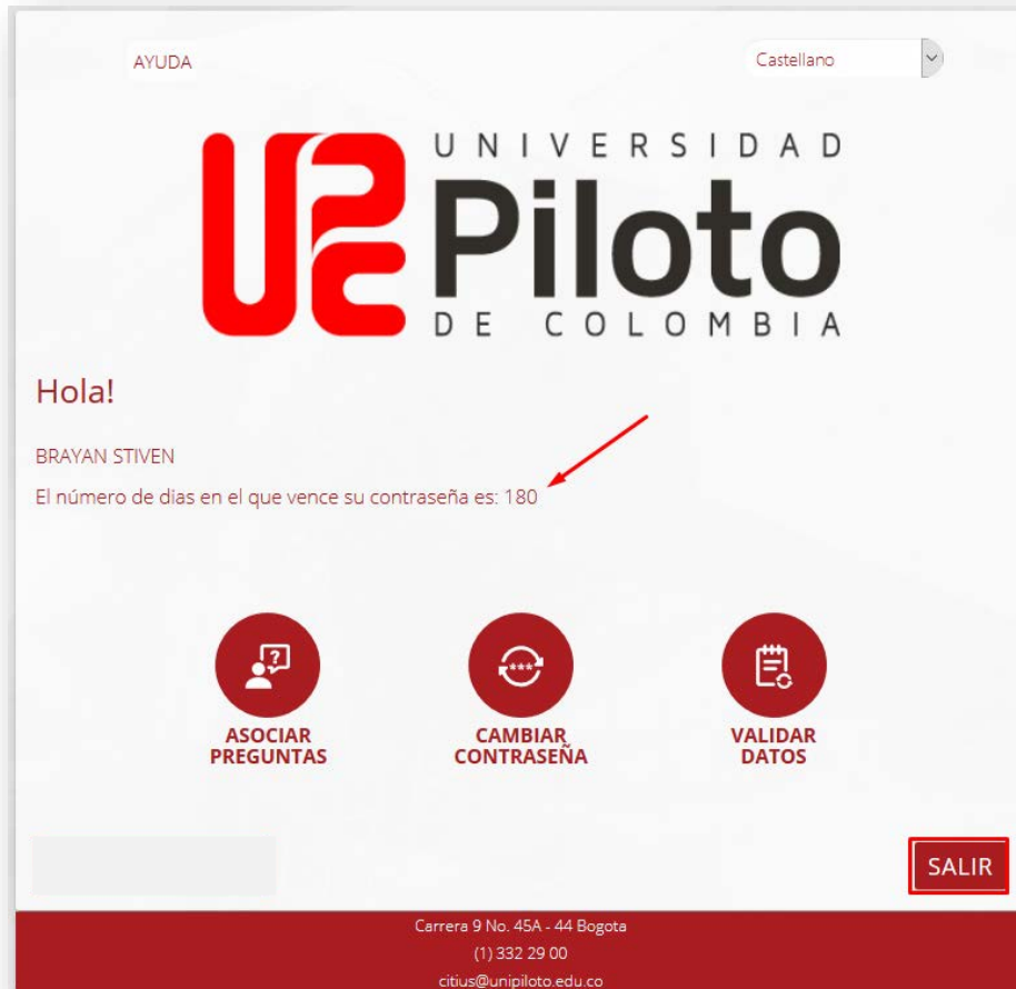
Imagen 16 - Actualización de días de vigencias de contraseña