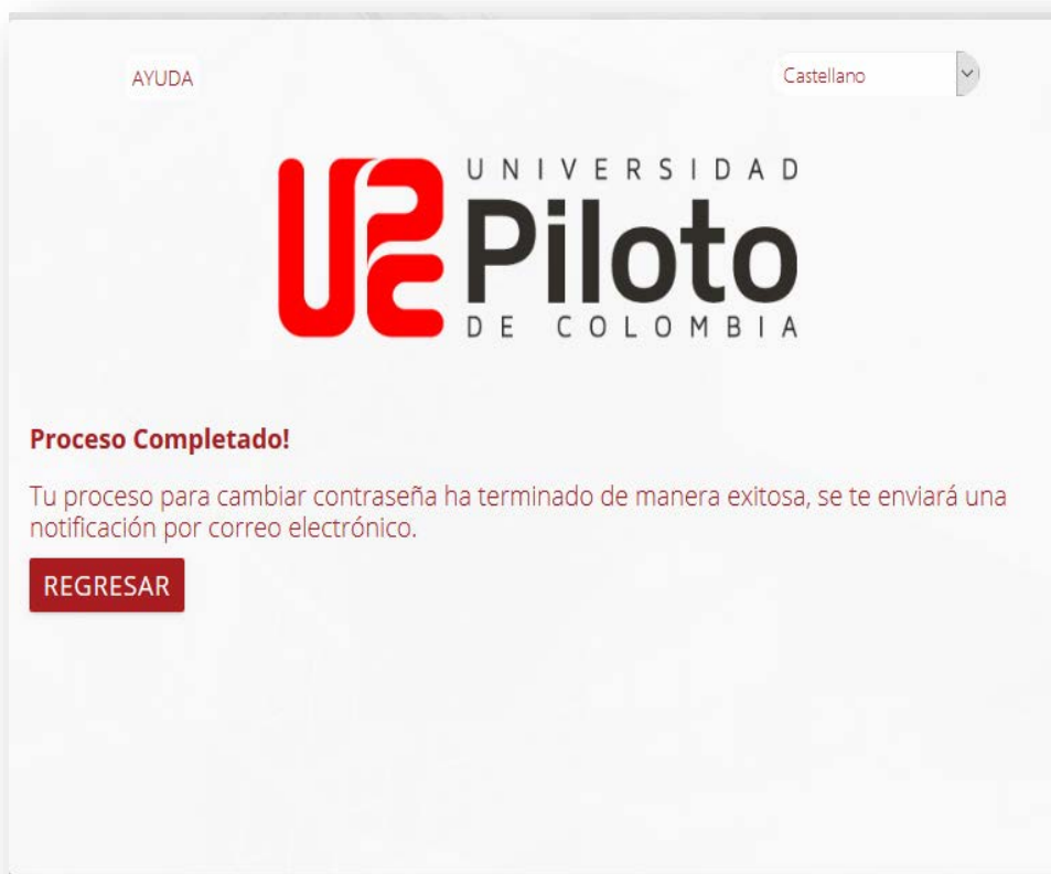
Imagen 15 - Proceso completado de cambio de contraseña

Por último, pulsamos clic en la opción Regresar .