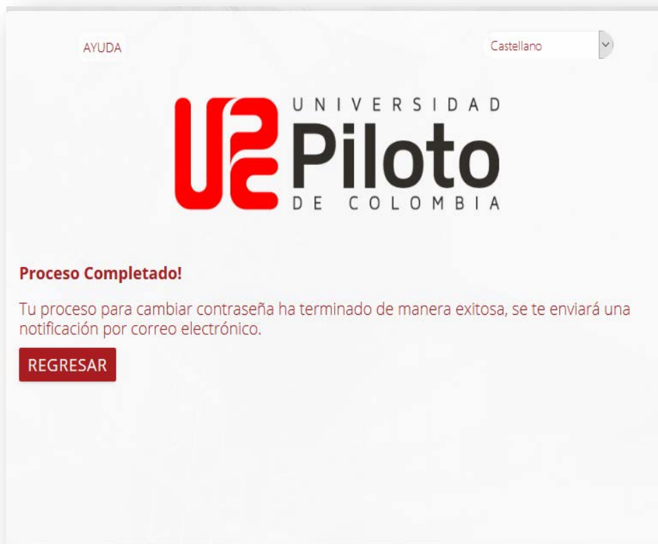
Imagen 8 - Proceso completado de cambio de contraseña

Por último, pulsamos clic en la opción Regresar .